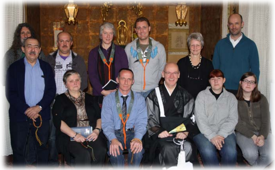
Deelnemers aan Hōonkō in jikōji

* Op zondag 20/11/20/11 ( typografisch grapje ) vierden we Hōonkō, Feest van dankbaarheid voor Shinran Shōnin, één van onze drie zogenaamde rode feestdagen – en we merkten het: we verwelkomden die dag een aantal extra sanghaleden die er niet iedere keer kunnen bijzijn. Er vervoegden ons zelfs twee leden van de Duitse sangha.