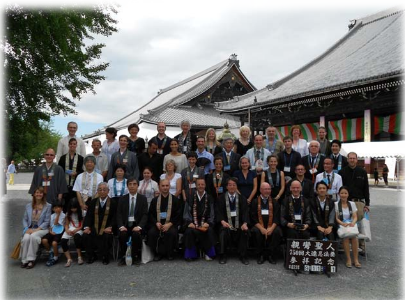
Shinran Shōnin 750 jaar: Europese deelnemers