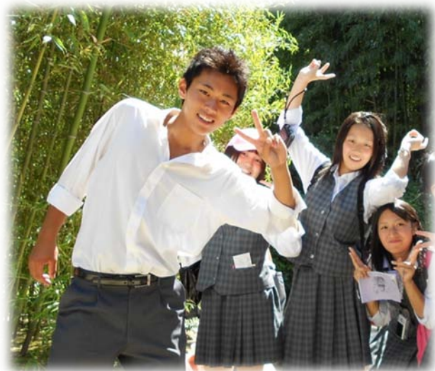
I am a coor guy