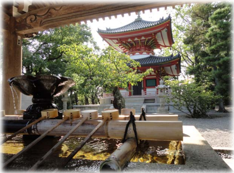
Tahōtō (pagode) van Chion-in