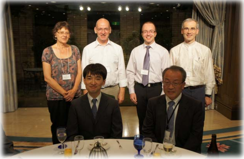
Jikōji-sangha samen met Shinmonsama en Rev. Esho Sasaki (foto: Jōshin Kamuro)